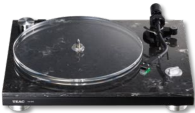
TN-570 1.000 €* Platine Tourne-Disque 33/45 tr.

entraînement haute précision \pm 0,05\% châssis lourd 9,0 kg | préampli phono sortie numérique Toslink 48/96/192 kHz sorties analogique & USB