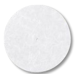
TA-TS30 UN 30 €* Couvre plateau