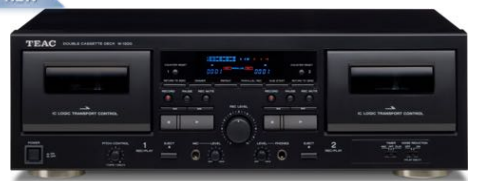
W-1200 450 €* BLACK

Platine double K7 Platine double enregistrement | USB Out entrée Micro mixable | sortie casque télécommande IR | Pitch control