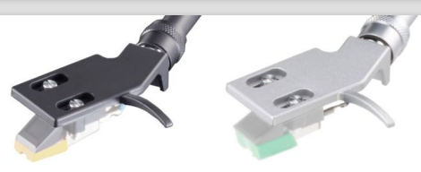
TA-HS2 40 €* BLACK

Enceintes actives amplification 2x14W entrées RCA, jack 3,5 1 active + 1 passive