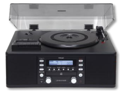
LP-R 550 USB 450 €* BLACK

Platine double K7 Platine double enregistrement | USB Out entrée Micro mixable | sortie casque télécommande IR | Pitch control