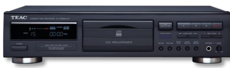
CD-RW 890 400 €* BLACK

Lecteur / Enregistreur CD entrées Toslink & analogiques sortie Ligne | télécommande IR