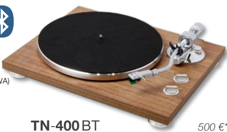
TN-400 BT 500 €* Platine Tourne-Disque 33/45/78 tr.

entraînement courroie haute précision châssis MDF 4,9 kg | préampli phono sorties analogique, USB | Bluetooth cellule MM type AT-95E