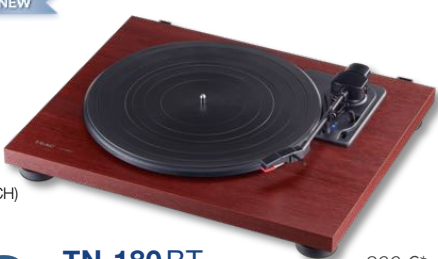
TN-180 BT 200 €* Platine Tourne-Disque 33/45/78 tr.