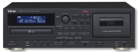
AD-850 450 €* BLACK

Système CD Vinyle Tuner BT lecteur CD MP3/WMA | USB | Tuner FM Bluetooth® | tourne-disque 33/45/78 tr.