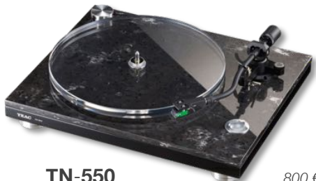
TN-550 800 €* Platine Tourne-Disque 33/45 tr.

entraînement haute précision \pm 0,05\% châssis lourd 9,0 kg sorties audio analogique cellule MM type AT-100E