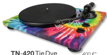
TN-420 Tie Dye 400 €* Platine Tourne-Disque 33/45 tr.

entraînement courroie haute précision châssis MDF 4,9 kg | préampli phono sorties audio analogique & USB cellule MM type AT-95E