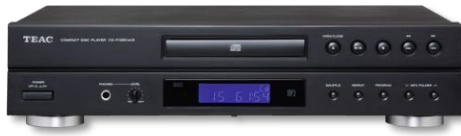
CD-P 1260 MKII 200 €* BLACK

Lecteur CD sortie analogique & casque | DAC Wolsoln lecture CD MP3/WMA | télécommande IR