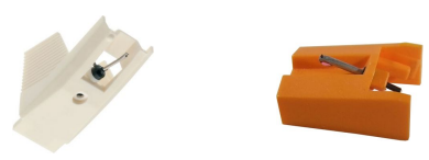
STL-650 60 €* / STL-122 40 €* BLACK

Porte cellule universel pour TN-300 à TN-570