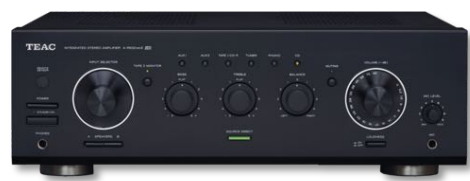
A-R 630 MKII 300 €* BLACK

Amplificateur stéréo 2x90 W / canal DIN/4Ω entrée Micro mixable | Phono | 6 Line IN sorties enceintes A&B