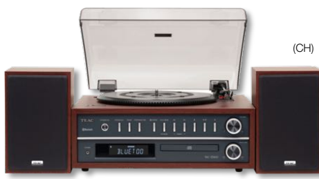
MC-D 800 350 €* WOOD BLACK

Système CD Vinyle Tuner BT lecteur CD MP3/WMA | USB | Tuner FM Bluetooth® | tourne-disque 33/45/78 tr.