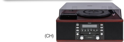
LP-R 500 430 €* WOOD BLACK

Système CD Vinyle K7 lecteur enregistreur CD & K7 tuner FM | tourne-disque 33/45/78 tr.