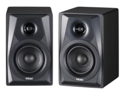
LS-M 100 130 €* BLACK

Amplificateur stéréo 2x90 W / canal DIN/4Ω entrée Micro mixable | Phono | 6 Line IN sorties enceintes A&B